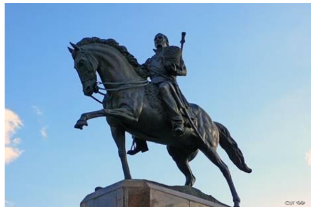
Памятник М.И. Платову в Новочеркасске