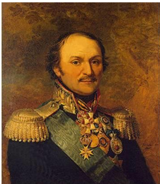
Атаман М.И. Платов (Художник Дж. Доу 1819-1825)

Матвей Иванович Платов родился 6 августа 1753 года в Старо-Черкасской станице. Отец его был заслуженным войсковым старшиной. Народное предание сохранило рассказ о рождении будущего атамана. В этот день отец пошёл посмотреть своё судно. Вдруг пролетающая мимо птица уронила ему на шапку кусок хлеба. Отец перекрестился, взял кусок и положил его к себе в карман. Когда же он подошёл к берегу, к его ногам из воды выпрыгнул громадный сазан. На обратном пути домой Платов узнаёт, что у него родился сын. Он собрал своих друзей, угостил их рюмкой водки, закусил хлебом, оброненным птицей, и угостил гостей жареным сазаном, так чудесно ему доставшимся.