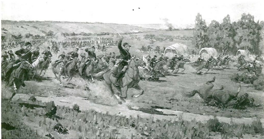
Рейд казаков Платова в тыл наполеоновской армии.

Талант казачьего полководца у Платова стал всем виден и замечен в ходе войн против наполеоновской Франции, которые более десятилетия сотрясали Европу. Новым боевым поприщем для атамана стала русско-турецкая война 1806-1812 годов. Самой большой победы в этой войне казаки добились 23 сентября 1809 года, когда был наголову разбит пятитысячный турецкий корпус в полевом бою между неприятельскими крепостями Силистрия и Руцук. Эта победа принесла Платову чин генерала от кавалерии.