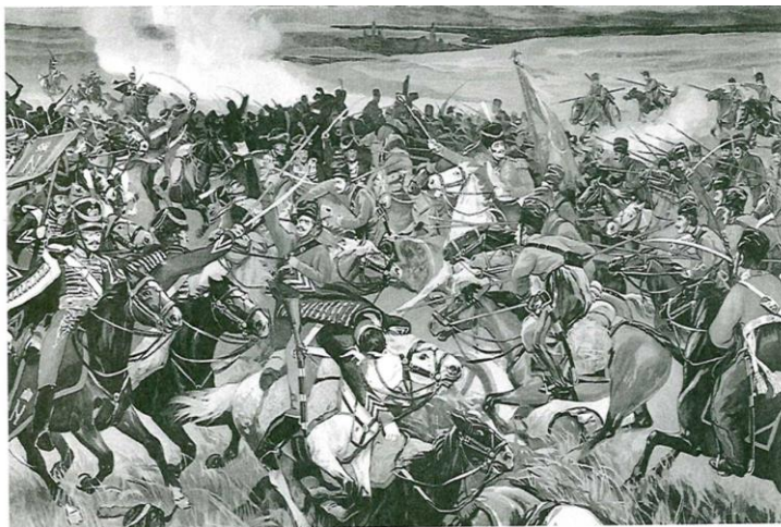
Атака донских казаков М.И. Платова.

Атаманом Платов был особенным. Едва вступил он в управление войском, как задумал много различных перемен для усиления воинского духа донских казаков. Казака он считал природным воином и требовал, чтобы отцы учили детей казачьему делу и сами его не забывали. Атаман и сам жил просто. Часто глядя на роскошные палаты, которыми обзаводились казаки, Платов говаривал: «Мы не рождены ходить по паркетам, да сидеть на бархатных подушках, там вовсе можно забыть родное ремесло. Наше дело ходить по полю, по болотам, а сидеть в шалашах, а ещё лучше, под открытым небом, чтобы и зной солнечный и всякая непогода не была нам в тягость. Так и будешь всегда донским казаком...»