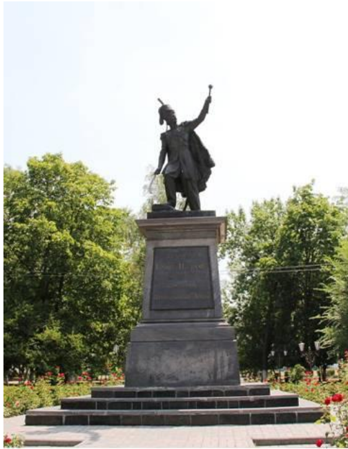
Памятник М.И. Платову в Новочеркасске