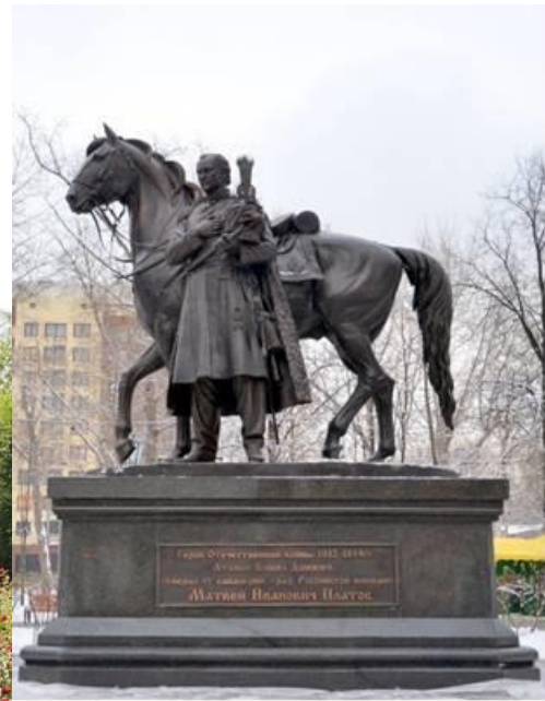
Памятник М.И. Платову в Москве