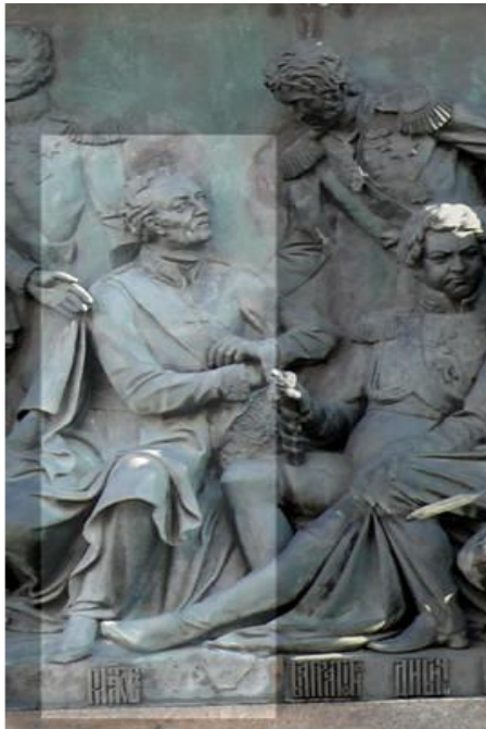
Матвей Платов на памятнике «Тысячелетие России» в Великом Новгороде