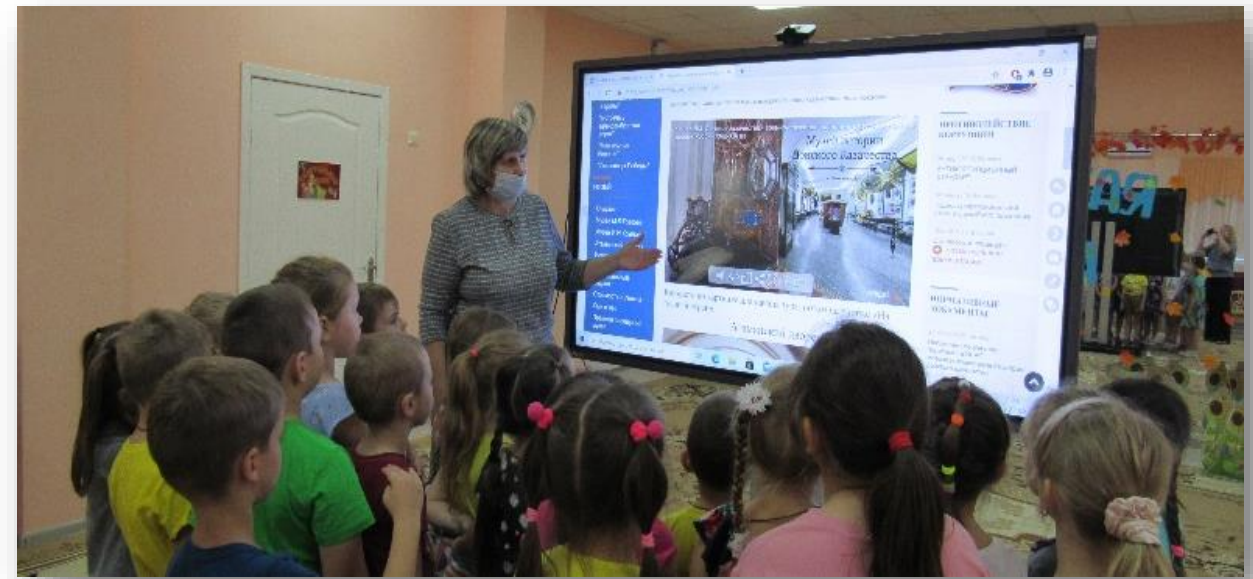
Занятия познавательного цикла с использованием ИКТ