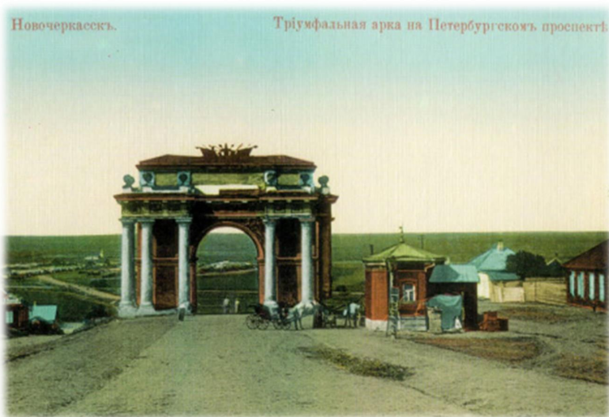
Триумфальная арка (19 век) на Санкт-Петербургском проспекте (спуск Герцена)