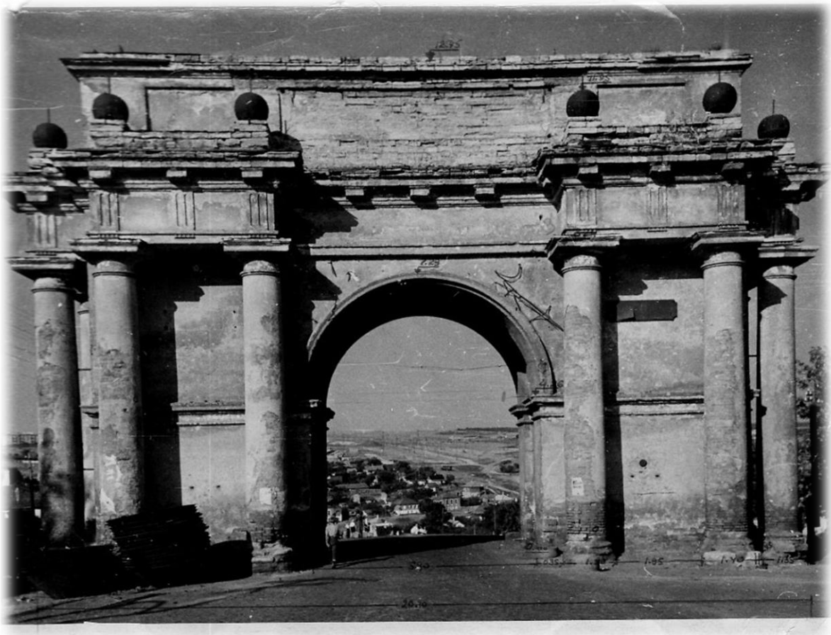
Триумфальная арка (20 век) на проспекте Платовском после Великой Отечественной войны (1941-1945г.г.)