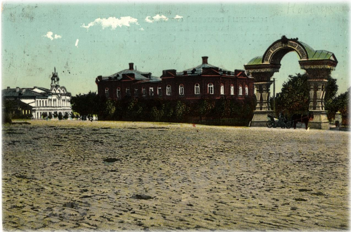
Триумфальная арка (19 век) «Крещенский спуск» около Вознесенского собора (Красный спуск)