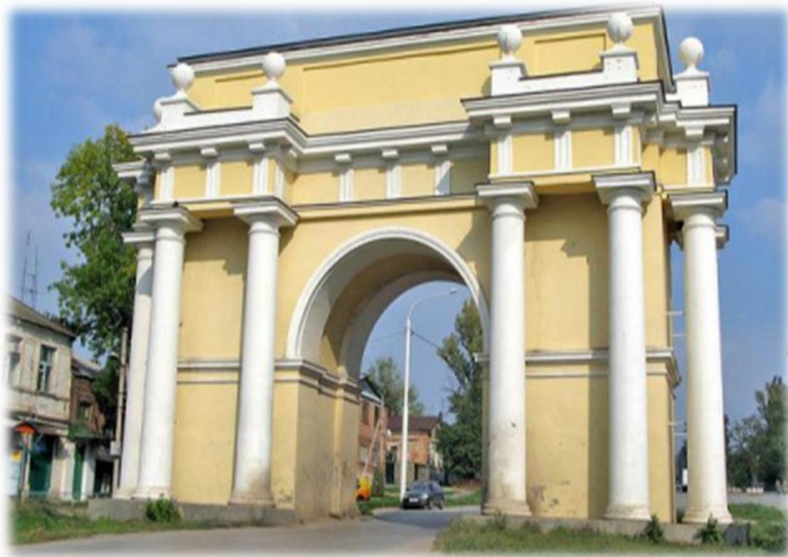
Триумфальная арка с запада