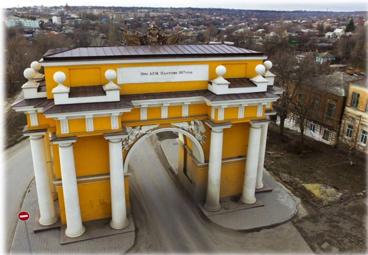
Триумфальная арка (21 век) на проспекте Платовском.

Новочеркасск богат историческими памятниками. Первое, что видит человек, въезжающий в город -это огромные Триумфальные арки. Во все века они выглядели по-разному, но всегда являлись визитной карточкой и настоящим украшением города Новочеркаска.