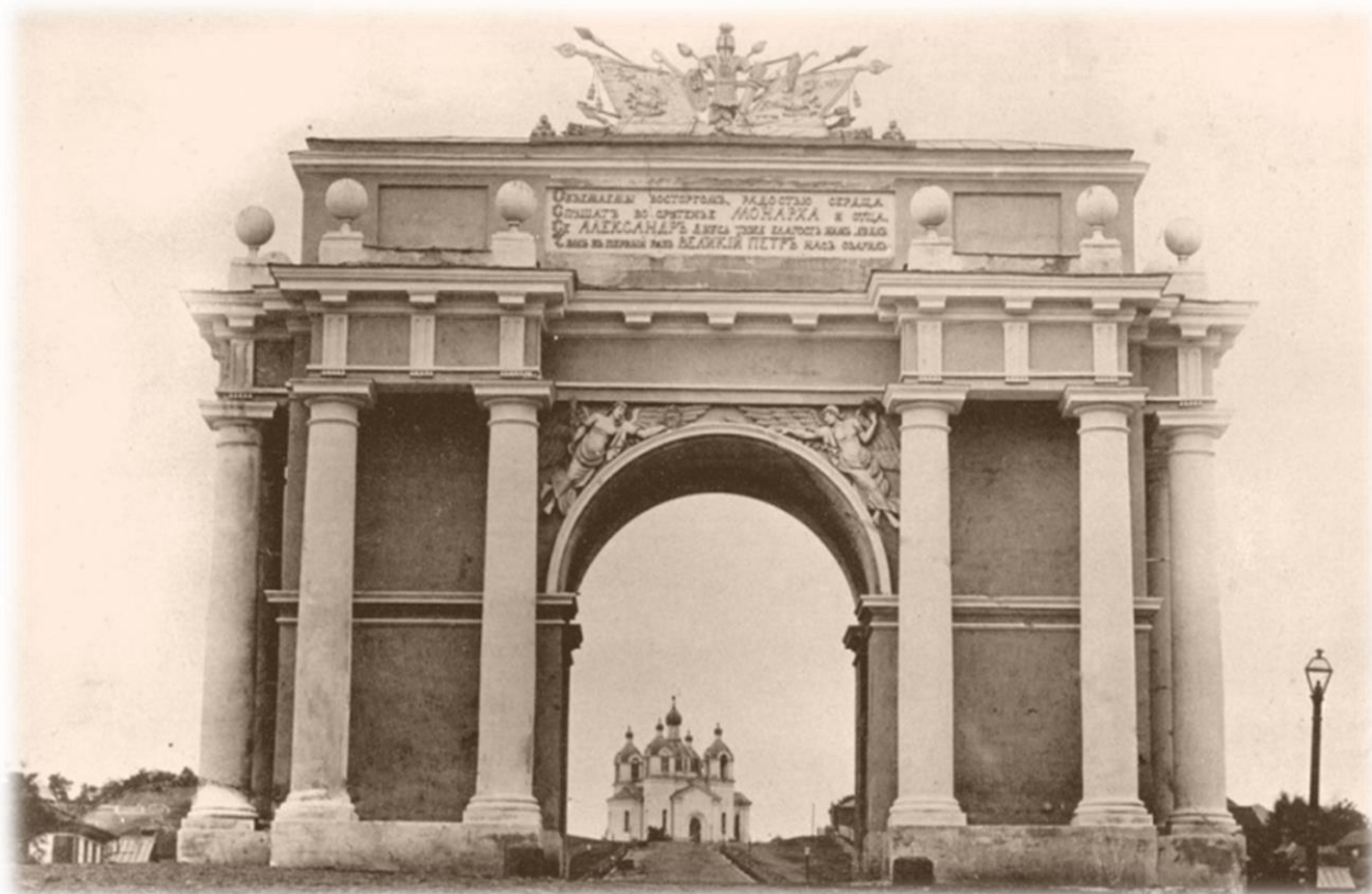
Триумфальная арка (19 век) на Санкт-Петербургском проспекте (спуск Герцена)