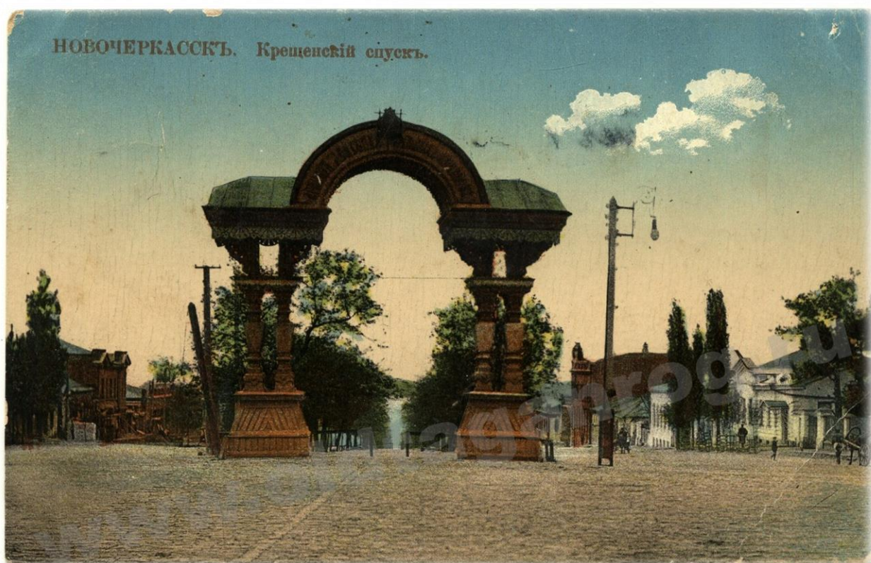
Триумфальная арка (19 век) «Крещенский спуск» около Вознесенского собора (Красный спуск)

Это была уже традиция столичного Новочеркасска - встречать своих Государей Императоров Триумфальными воротами, начатая в 1817 г., когда в Новочеркасске построили первые каменные ворота для встречи Императора Александра I. Их в народе так прозвали «Александровские триумфальные ворота в Новочеркасске».