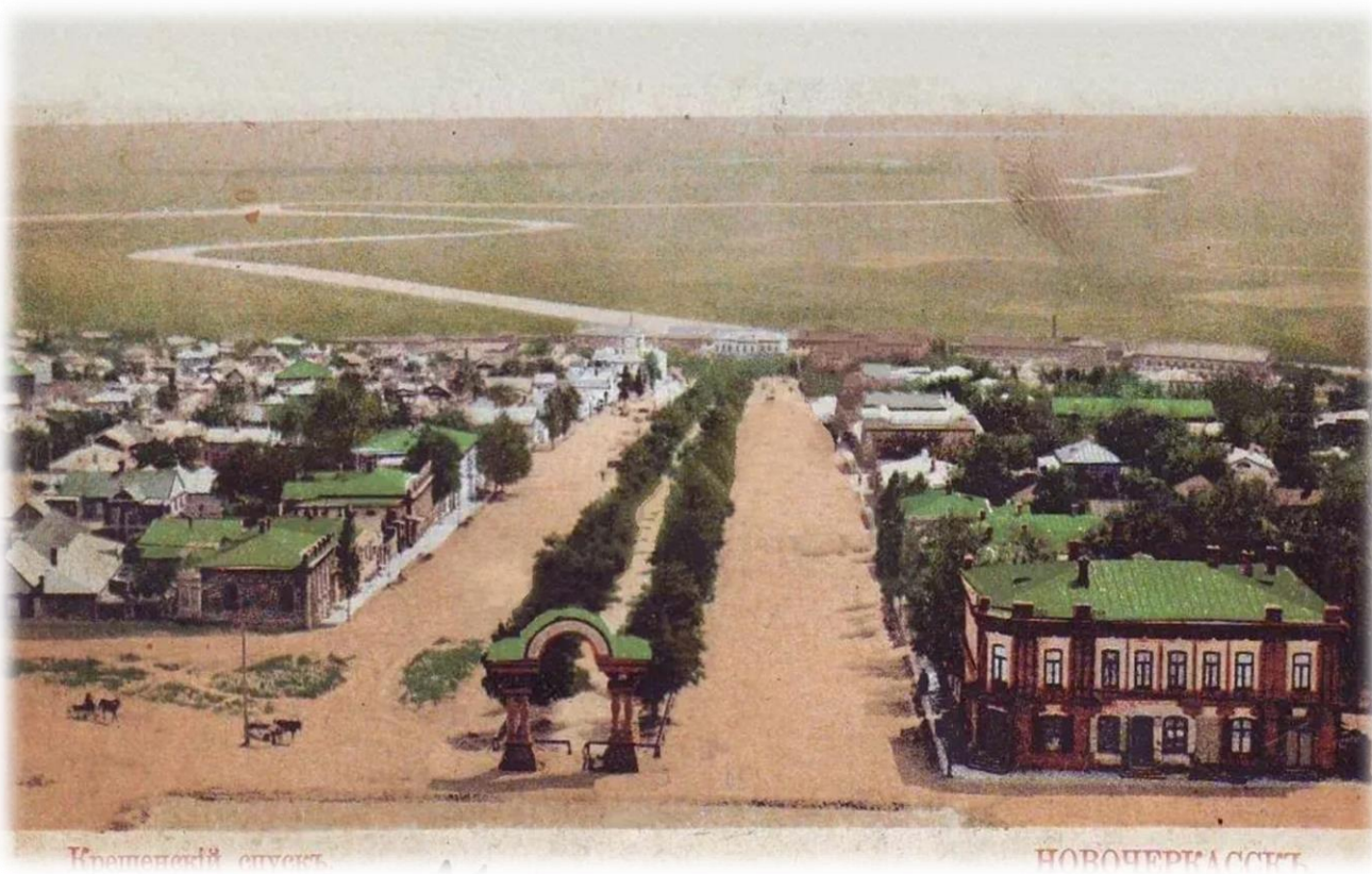
Триумфальная арка (19 век) «Крещенский спуск» около Вознесенского собора (Красный спуск)