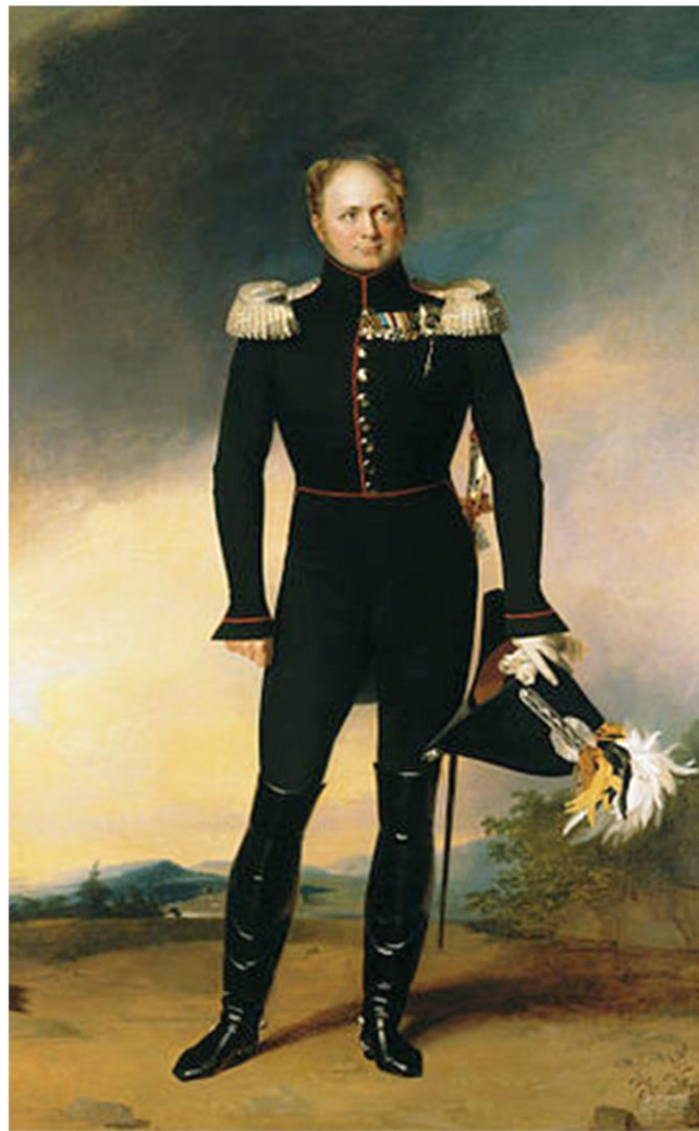
Александр I Павлович