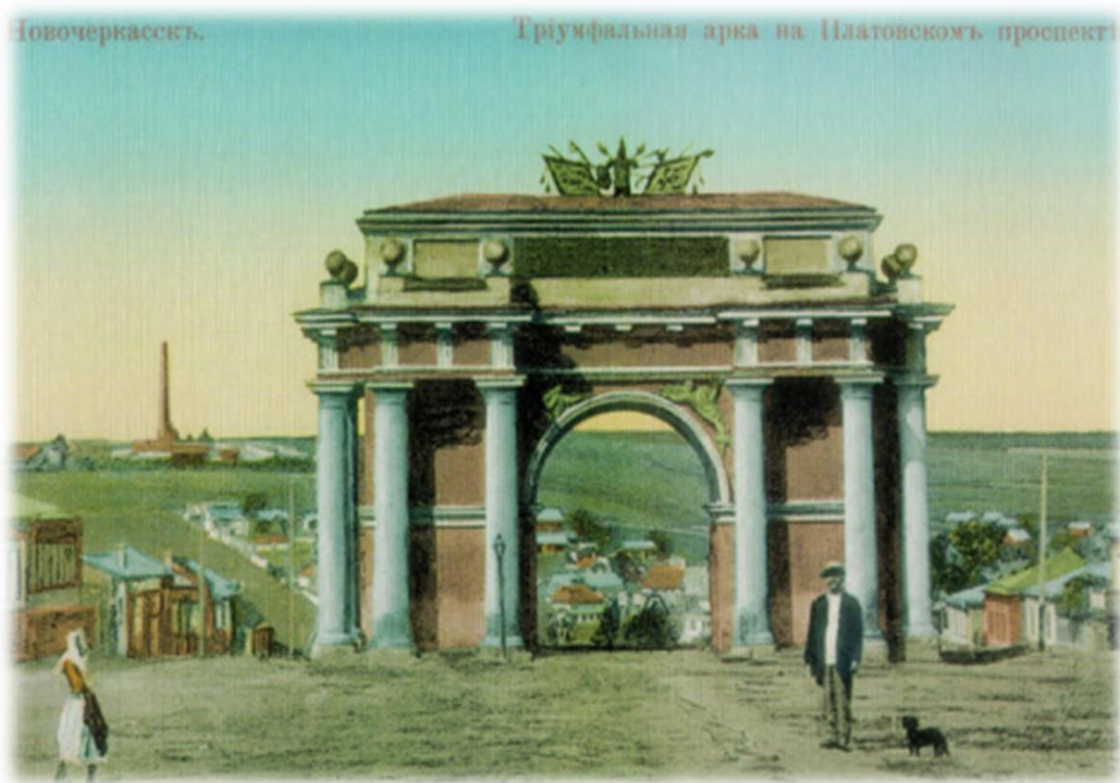
А такая она на старых открытках